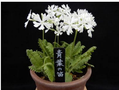
9. 青葉の笛／あおばのふえ （園芸種）