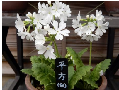
4. 平方（白）／ひらかた（しろ） （野生種）