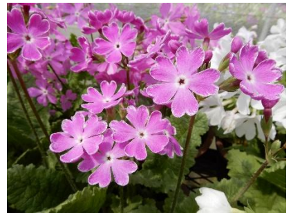
8. 駅路の鈴／えきろのすず （園芸種）