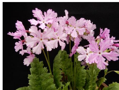
10. 落葉衣／おちばごろも （園芸種）