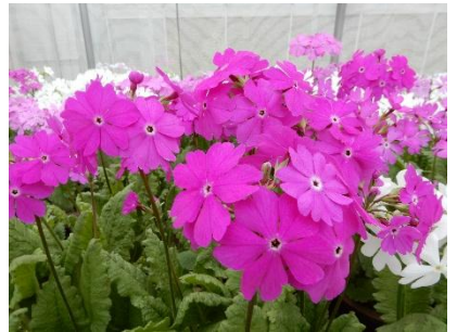
5. 田島（紅）／たじま（べに） （野生種）