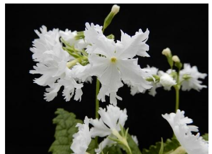
11. 白滝／しらたき （園芸種）