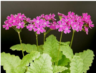
6. 南京小桜／なんきんこざくら （園芸種）