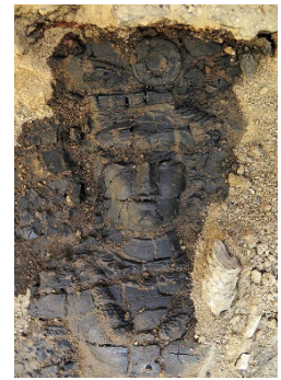
出土直後の女神ナナの頭部