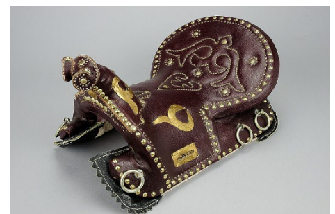
ウマ用鞍一式 (国立民族学博物館所蔵)

第二部では、人とモノの移動や運搬に使われた資料（ くら 鞍や荷袋、二輪馬車など）や、バザールで売り買いされる資料（陶器、 ししゅう 刺繍布、毛織物など）、現代の楽器や信仰に関する資料まで、広くユーラシアにおける交流の様子を示すようなみんぱく収蔵の資料を中心に展示します。