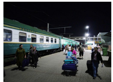
暮夜のタシュケント南駅 ウズベキスタン、 2024年