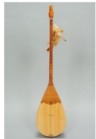
ドンブラ（弦楽器） (国立民族学博物館所蔵)

ソグド商人と呼ばれる6～8世紀頃を中心にシルクロード交易で活躍した人びとに関する資料（ よう 桶、伎楽面、楽器、絹織物など）も、日本国内の貴重な借用資料とあわせて紹介・展示します。