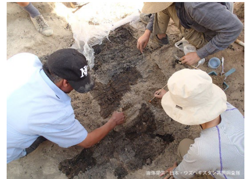
木彫板発掘時の様子

過去には、ルーブル美術館、大英博物館で展示され、本特別展が日本初・世界で3番目（ウズベキスタン国内を除く）の展示となります。展示の実現にあたっては、ウズベキスタンからの輸送費を確保するためにクラウドファンディングを実施し、多くの方からのご支援を得ました。日本人研究者がかかわった発掘調査で発見された、この貴重な文化財を、ぜひとも日本の皆さんにも実際にその目で見ていただきたいと強く願っています。