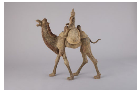
ソグド商人像（特別展で展示予定） 浜名梱包輸送シルクロード・ ミュージアム蔵

問い合わせ 国立民族学博物館友の会（公益財団法人 千里文化財団） 電話 06-6877-8893