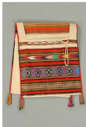
【3】 くらぶくろ 鞍袋