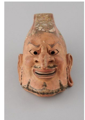
伎楽面 酔胡王 （国立民族学博物館所蔵）