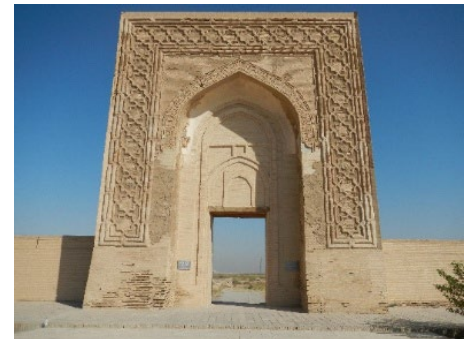
キャラバンサライ (隊商宿) の遺跡 「ラバティ・マリク」 2012年撮影