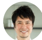
パネリスト コウケンテツ